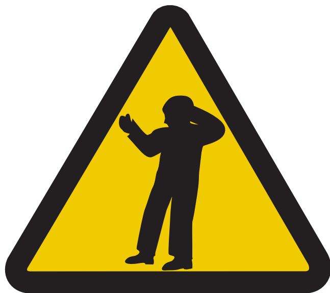
Capogiri e svenimenti