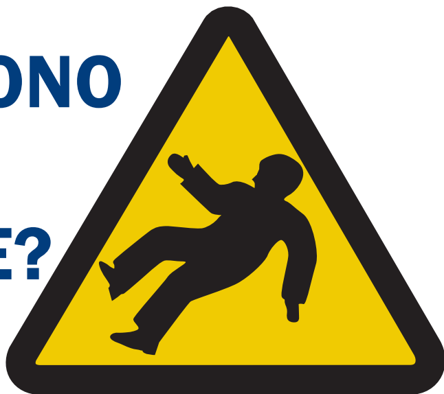
Scivolare e inciamparsi