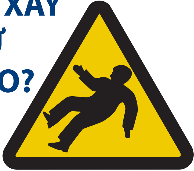
Trượt & vấp