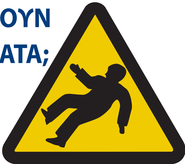
Γλιστρήματα & Παραπατήματα