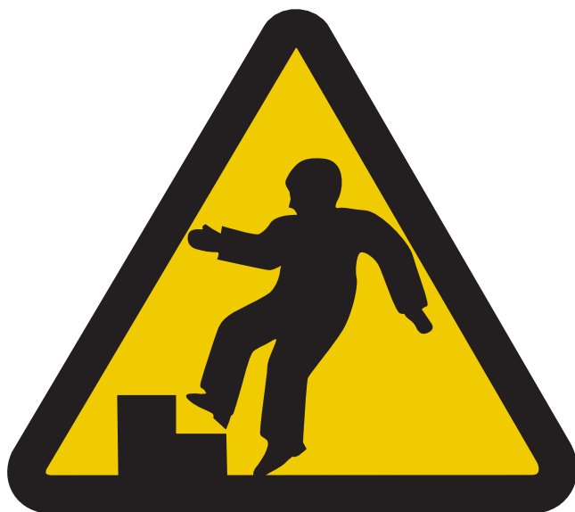
Χάσιμο της ισορροπίας σας