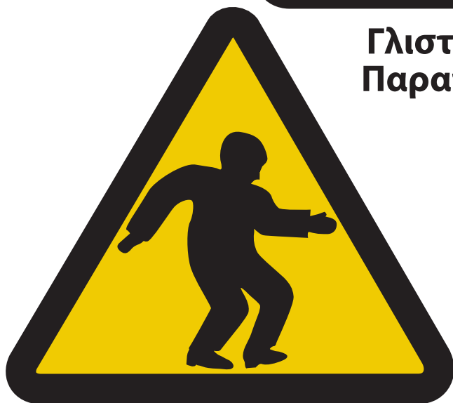
Δεν βαστάνε τα πόδια