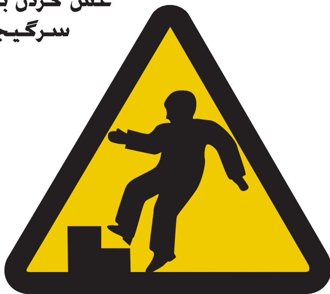
از دست دادن تعادل تان